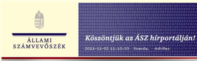
A hírportál témái