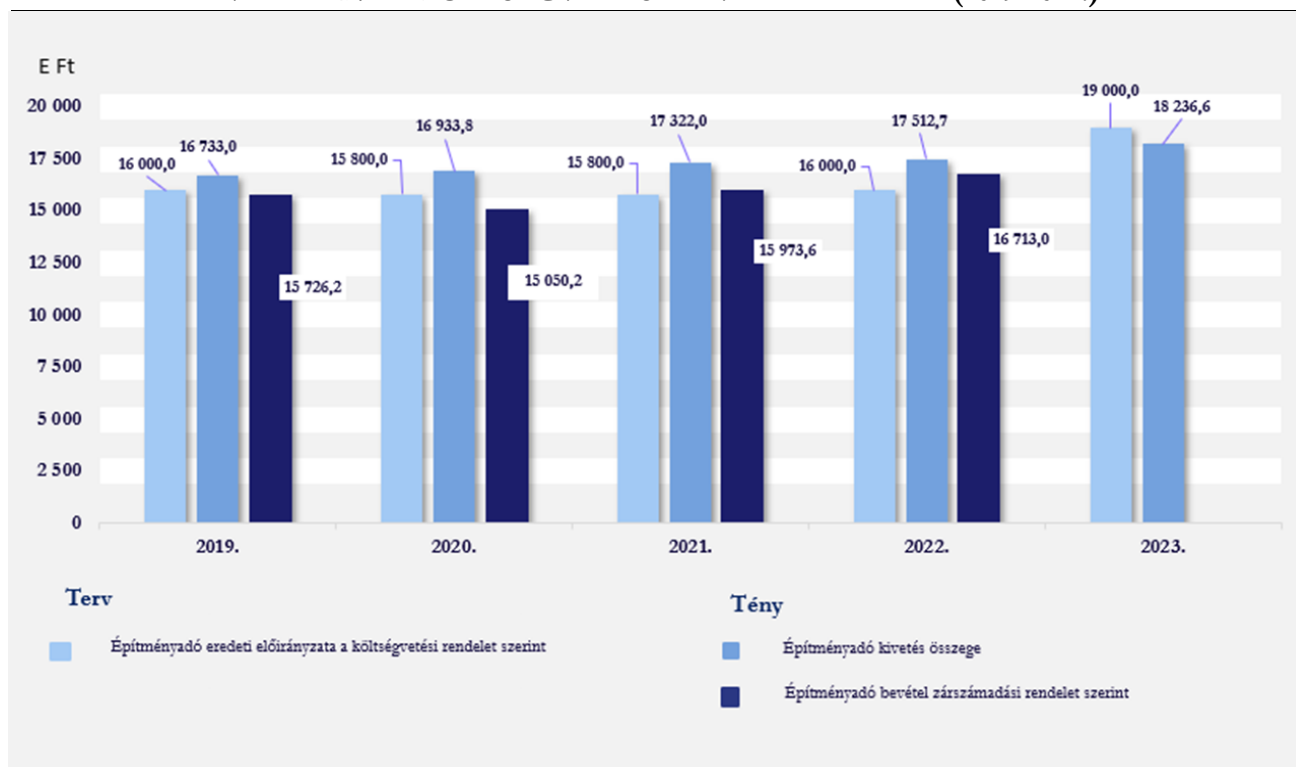
AZ ÉPÍTMÉNYADÓ KÖLTSÉGVETÉSI ELŐIRÁNYZATAI, ADÓKIVETÉSEI (2019-2023.), VALAMINT A KÖLTSÉGVETÉSI BEVÉTELI ADATAI (2019-2022.)

Forrás: Az ellenőrzött szervezet adatszolgáltatása, az Önkormányzati rendeletek Nemzeti Jogszabálytár alapján ÁSZ szerkesztés