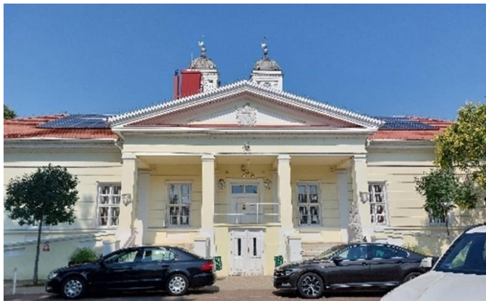
Kunhegyesi Polgármesteri Hivatal épülete

Kunhegyes az Észak-Alföldi régióban, Jász-Nagykun-Szolnok vármegyében található város, a Kunhegyesi járás székhelye. Állandó lakosainak száma a 2021. január 1-jei 7217 főről 2024. január 1-jére 6829 főre csökkent a KSH 7 adatai szerint.