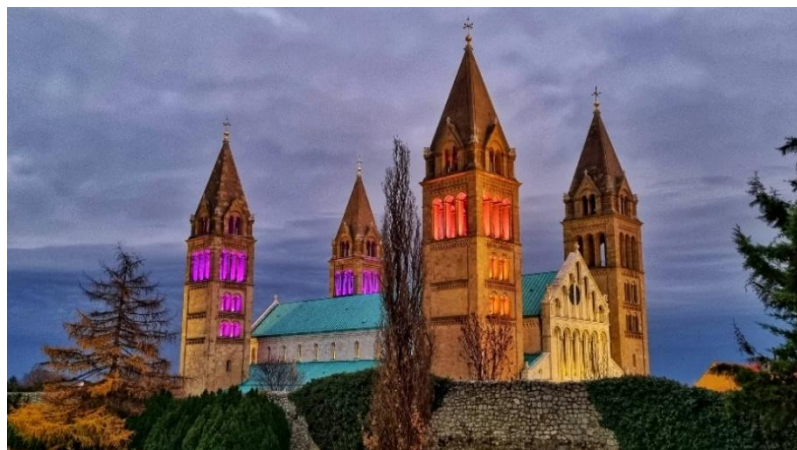
Pécsi Székesegyház

Az Ehtv. Melléklete szerint a 27 bevett egyház közé tartozó Magyar Katolikus Egyház belső egyházi jogi személye a Pécsi Egyházmegye, amelyet Szent István király alapított 1009. augusztus 23-án. Működése jelenleg két közigazgatási területi egységre, Tolna- és Baranya vármegyére terjed ki. Az Egyházmegye püspöki székhelye Pécs, katedrálisa a pécsi Szent Péter és Szent Pál Székesegyház.