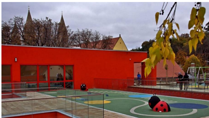
Szent Mór Iskolaközpont Tagóvoda

A Magyarországon működő vallási közösségek számos társadalmi és közfeladatot látnak el, amelyhez az elmúlt évek tendenciáit megfigyelve, jelentős, egyre növekvő mértékű költségvetési támogatásban részesültek. Az elmúlt években az állam által nyújtott jelentős összegű támogatások miatt a vallási közösségek egyre hangsúlyosabb szerepet kapnak a közfeladatellátásban. A közérdeklődés folyamatos, hiszen a társadalom részéről kérdésként merül fel, hogy az állam által nyújtott közpénz hasznosult-e, elérte-e a célját, továbbá jogos elvárás, hogy az állam által nyújtott támogatás felhasználása szabályszerűen, átláthatóan, ellenőrizhetően történjen meg.