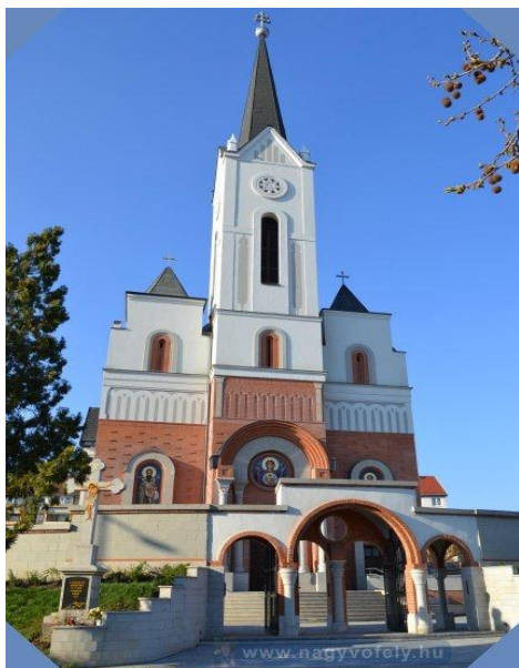
A Miskolci Egyházmegye temploma Forrás: Miskolci Egyházmegye Facebook oldala

Forrás: ÁSZ saját szerkesztés a Támogatói okirat és módosításai alapján