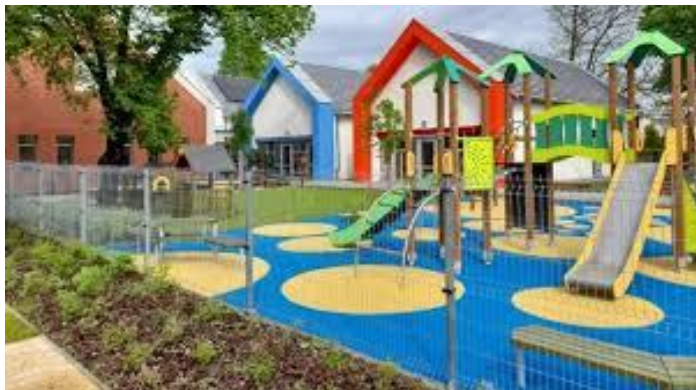
Szent Péter Görögkatolikus Óvoda és Bölcsőde

A Magyarországon működő vallási közösségek számos társadalmi és közfeladatot látnak el, amelyhez az elmúlt évek tendenciáit megfigyelve, jelentős, egyre növekvő mértékű költségvetési támogatásban részesültek. Az elmúlt években az állam által nyújtott jelentős összegű támogatások miatt a vallási közösségek egyre hangsúlyosabb szerepet kapnak a közfeladatellátásban. A közérdeklődés folyamatos, hiszen a társadalom részéről kérdésként merül fel, hogy az állam által nyújtott közpénz hasznosult-e, elérte-e a célját, továbbá jogos elvárás, hogy az állam által nyújtott támogatás felhasználása szabályszerűen, átláthatóan, ellenőrizhetően történjen meg.