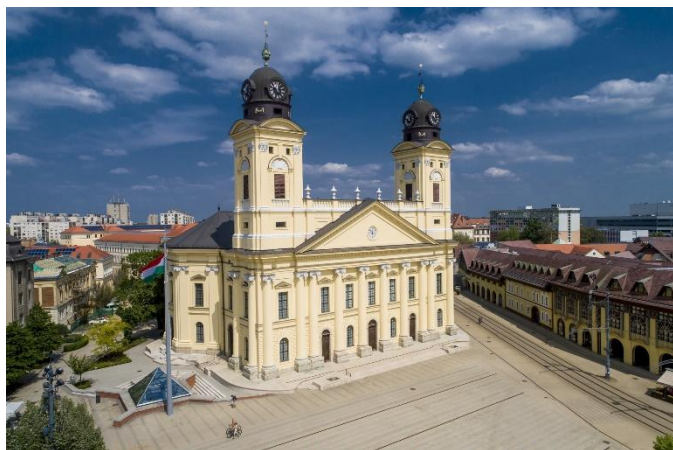
Debreceni Nagytemplom

A Tiszántúli Református Egyházkerület a Magyarországi Református Egyház négy egyházkerületének (Tiszáninneni Református Egyházkerület, Dunamelléki Református Egyházkerület, Dunántúli Református Egyházkerület és a Tiszántúli Református Egyházkerület) egyike, amely Kelet-Magyarországon helyezkedik el, területén kilenc egyházmegye található, központja Debrecen. A Tiszántúli Református Egyházkerület területén 90 oktatási intézmény – azaz óvoda, általános iskola, alapfokú művészeti oktatási intézmény, középiskola, felsőoktatási intézmény, illetve közoktatási feladatot