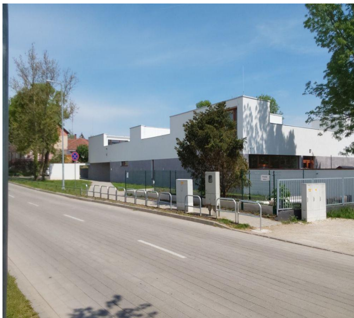
Szivárvány Református Óvoda

A Magyarországon működő vallási közösségek számos társadalmi és közfeladatot látnak el, amelyhez az elmúlt évek tendenciáit megfigyelve, jelentős, egyre növekvő mértékű költségvetési támogatásban részesültek. Az elmúlt években az állam által nyújtott jelentős összegű támogatások miatt a vallási közösségek egyre hangsúlyosabb szerepet kapnak a közfeladatellátásban. A közérdeklődés folyamatos, hiszen a társadalom részéről kérdésként merül fel, hogy az állam által nyújtott közpénz hasznosult-e, elérte-e a célját, továbbá jogos elvárás, hogy az állam által nyújtott támogatás felhasználása szabályszerűen, átláthatóan, ellenőrizhetően történjen meg.