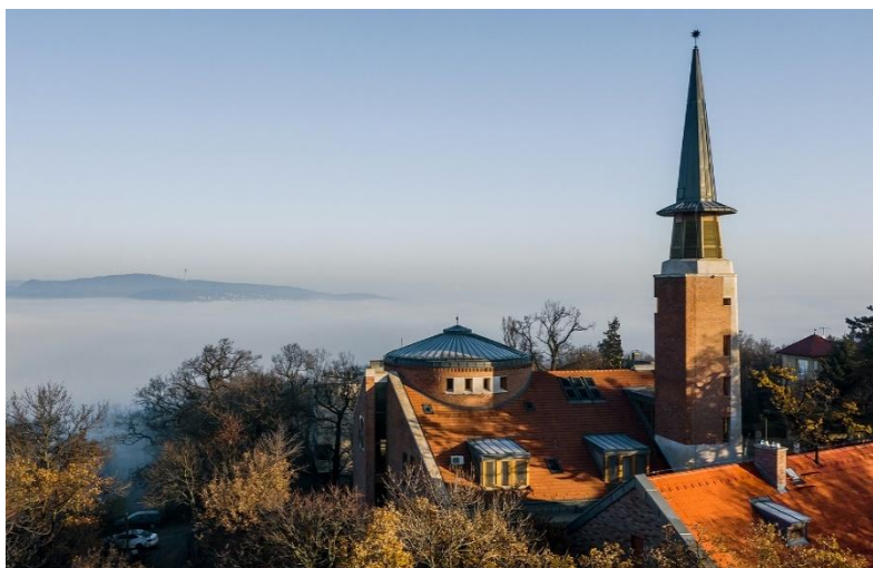
A Svábhegyi Református Egyházközség temploma