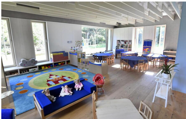
Báranyfélbő Svábhegyi Református Óvoda

A Magyarországon működő vallási közösségek számos társadalmi és közfeladatot látnak el, amelyhez az elmúlt évek tendenciáit megfigyelve, jelentős, egyre növekvő mértékű költségvetési támogatásban részesültek. Az elmúlt években az állam által nyújtott jelentős összegű támogatások miatt a vallási közösségek egyre hangsúlyosabb szerepet kapnak a közfeladatellátásban. A közérdeklődés folyamatos, hiszen a társadalom részéről kérdésként merül fel, hogy az állam által nyújtott közpénz hasznosult-e, elérte-e a célját, továbbá jogos elvárás, hogy az állam által nyújtott támogatás felhasználása szabályszerűen, átláthatóan, ellenőrizhetően történjen meg.