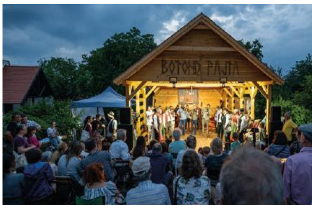
Forrás: az Alapítvány által megküldött ellenőrzési dokumentum (Kőfeszti – 2023 Programfüzet)

A „Káli-medencei kulturális közösségépítés és rendezvénysorozat - Káli-medence a magyarországi folklór központja 2023” programjainak megvalósítására kapott támogatásból az Alapítvány több kulturális rendezvényt szervezett. A KŐFESZTI FOLKKLUB és a KŐFESZTI - A SZABAD TÁNCCHÁZ rendezvényein a népzene és a hozzá kapcsolódó népszokások sokszínűségének bemutatása volt a cél, ezek mellett a KŐFESZTI - A NYUGALOM FESZTLVÁLJA jóval színesebb zenei palettát vonultatott fel – komolyzene, szakrális énekkar, rock and roll, blues, pop –, de emellett nem megfelelve a népzeneről sem, amely ezen a rendezvényen is hangsúlyos és kiemelt szerepet kapott. A támogatásból finanszírozták a kulturális rendezvényekhez kapcsolódó infrastruktúrát (pl. tereprendezés) is.