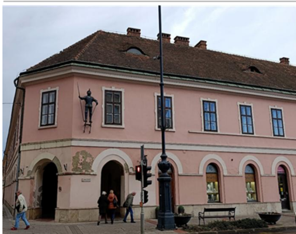
A NAGYKÁNIZSAI VASEMBERHÁZ