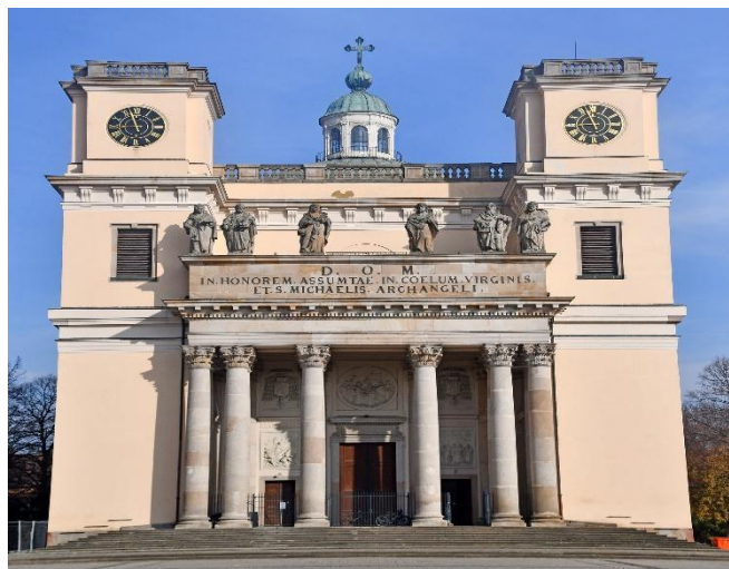
Váci Székesegyház - A fotó forrása:

Forrás: ASZ saját szerkesztés a Támogatói okirat, az elszámolás dokumentumai és a 709/2020. (XII.30.) Korm. rendelet 28 rendelkezése alapján