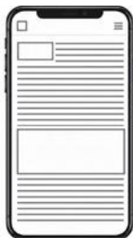
PR cikk napi hírlevélbe