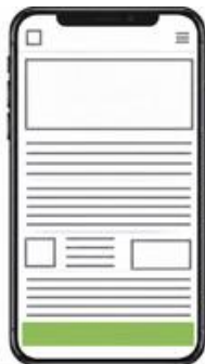
Lábléc minden oldalon 728x90 / 300x50 100.000,-Ft/hét