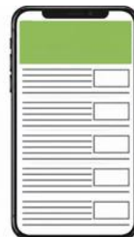
Newsletter header 730x270