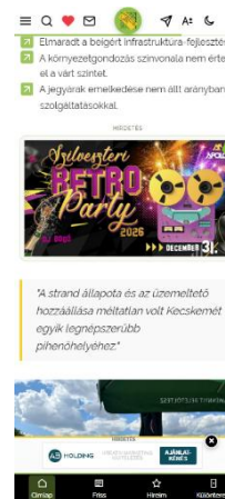
content banner flexible