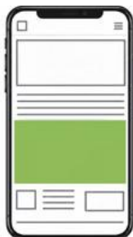
Medium rectangle 730x270 / 300x250