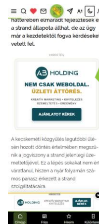
content rectangle 300x250