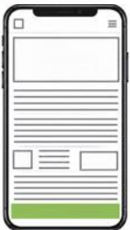
Tartalom lábléc 728x90 / 300x50