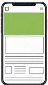
Tartalom fejléc 728x90 / 300x250