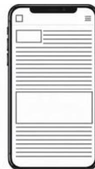
PR cikk kiküldés önállóan