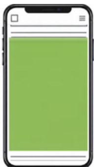
Reveal banner 600x1200 / 300x600