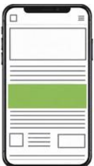
Medium flexible flexible / flexible