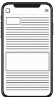
PR cikk főoldalon tartása