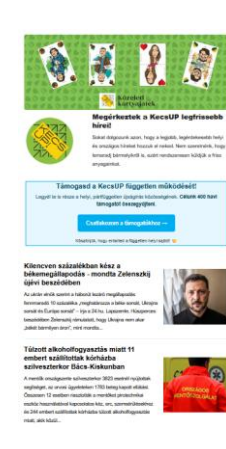
newsletter head 300x600