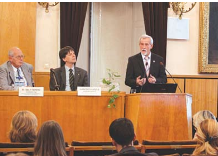
Warvasovszky Tihomir, az ÁSZ alelnöke előadást tart a pest megyei kormányhivatalban

Az összefoglaló tanulmány lehetőséget biztosít az országgyűlés és a kormányzati szervek, valamint a Magyarországon élő nemzetiségek jogainak védelmét ellátó biztoshelyettes számára, hogy szakmai alapon álló értékelést kapjanak az ÁSZ által korábban nem ellenőrzött, de a társadalmi érdeklődésre számot tartó, helyi nemzetiségi önkormányzatok működéséről, gazdálkodásáról, a nemzetiségi feladatok ellátására nyújtott közpénzek felhasználásának szabályszerűségéről. A jelentések és a hozzájuk kapcsolódó összefoglaló tanulmány ezáltal egyfajta tájékoztató pontként járul hozzá a jó kormányzáshoz.